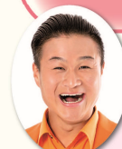
ティモンディ 高岸 宏行さん

日時/2024.8.18(日) 会場/福井県産業会館 2号館 内容/ティモンディ高岸宏行さんによる運動に関するトークショー 健康的な生活習慣(運動・食事)セミナー ウォーキング姿勢の対面指導と実践など