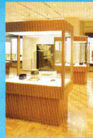
石川県輪島漆芸美術館