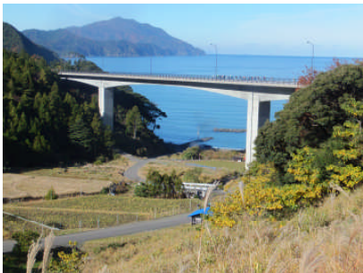
美しい日本海が・・・

22名の方が、短距離コースを選び、あいあいバスに乗車されましたが、観光バスが代行で来た為、皆さんビックリし、大喜びでした。ちなみに乗車賃200円でした。