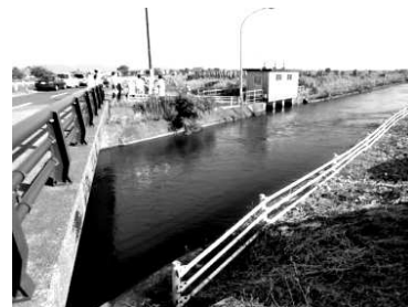
今に姿を消す十郷用水