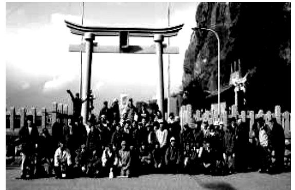
みんなで記念写真

スタートしていきなり、標高差約220mの登坂、でも遅れる人もなく隊列が長くなることはなかった。血が平から玉川温泉へ抜ける林道は積雪があり安全のため県道を迂回することになった。短縮コースはわずかで、大部分の人が健脚コースを完歩した。